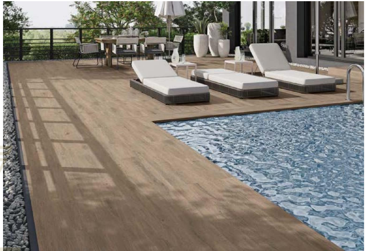
ANTI-SLIP ALABAMA QUERCIA RECT. 20X120. PELDAÑO RECTO ANT. C3 ALABAMA QUERCIA 33X120