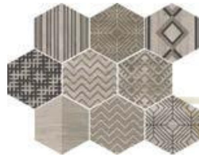
CEVb DECOWOOD SNOW MIX 25 X 29 / 10" X 11" R96/M