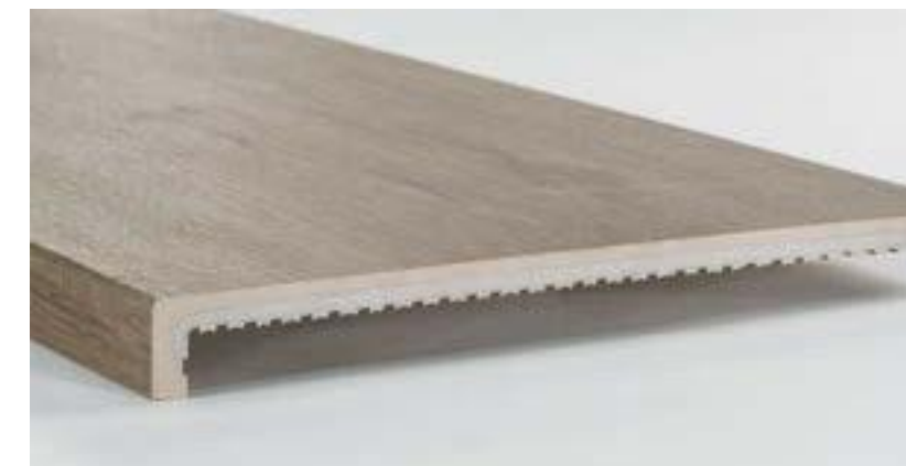
PELDAÑO RECTO ALABAMA