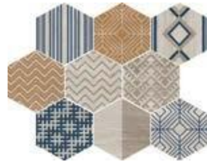
CEVb DECOWOOD WHITE MIX 25 X 29 / 10" X 11" R96/M