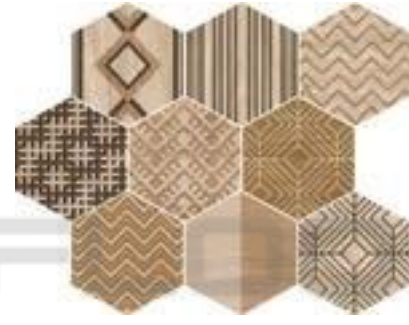
CEVb DECOWOOD HAYA MIX 25 X 29 / 10" X 11" R96/M