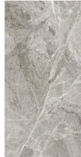
Gq SILVER GREY MATT RECT 60 X 120 / 24" X 48" P42/M