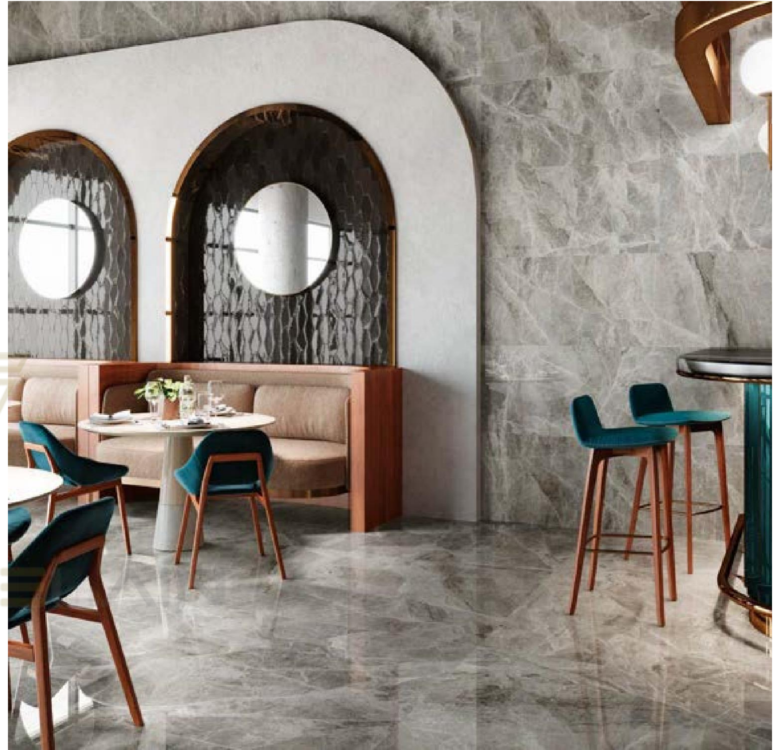
SILVER GREY POL. RECT 60X120, SILVER GREY POL RECT 120X120, HARLEQUIN GRAPHITE 10X20