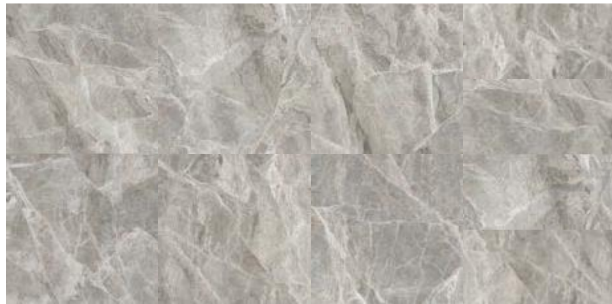
120X120 - 8 PIEZAS / 8 PIECES / 8 PIÈCES 60X120 - 16 PIEZAS / 16 PIECES / 16 PIÈCES