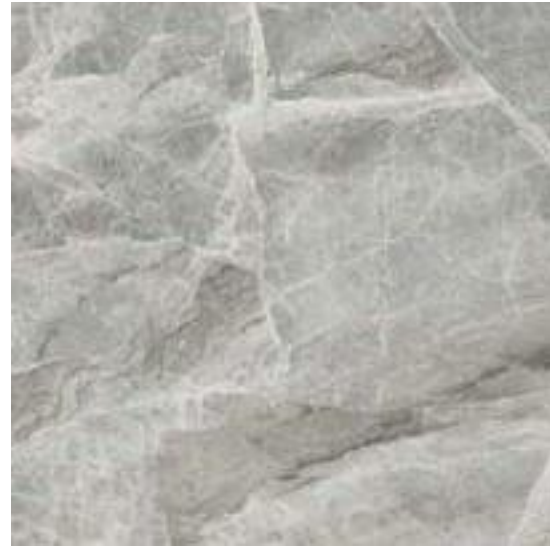
No SILVER GREY POL RECT 120 X 120 / 48" X 48"