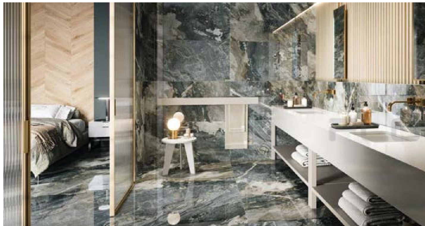
DEDALUS POL RECT 120X120. DEDALUS POL RECT 60X120.

60X120 - 12 PIEZAS / 12 PIECES / 12 PIÈCES