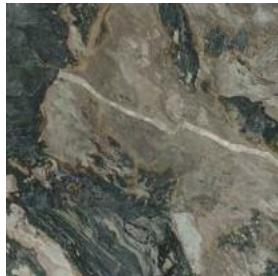
DEDALUS POL RECT 120 X 120 / 48'' X 48''