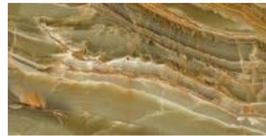
EMERALD ONIX POL RECT 60 X 120 / 24'' X 48''