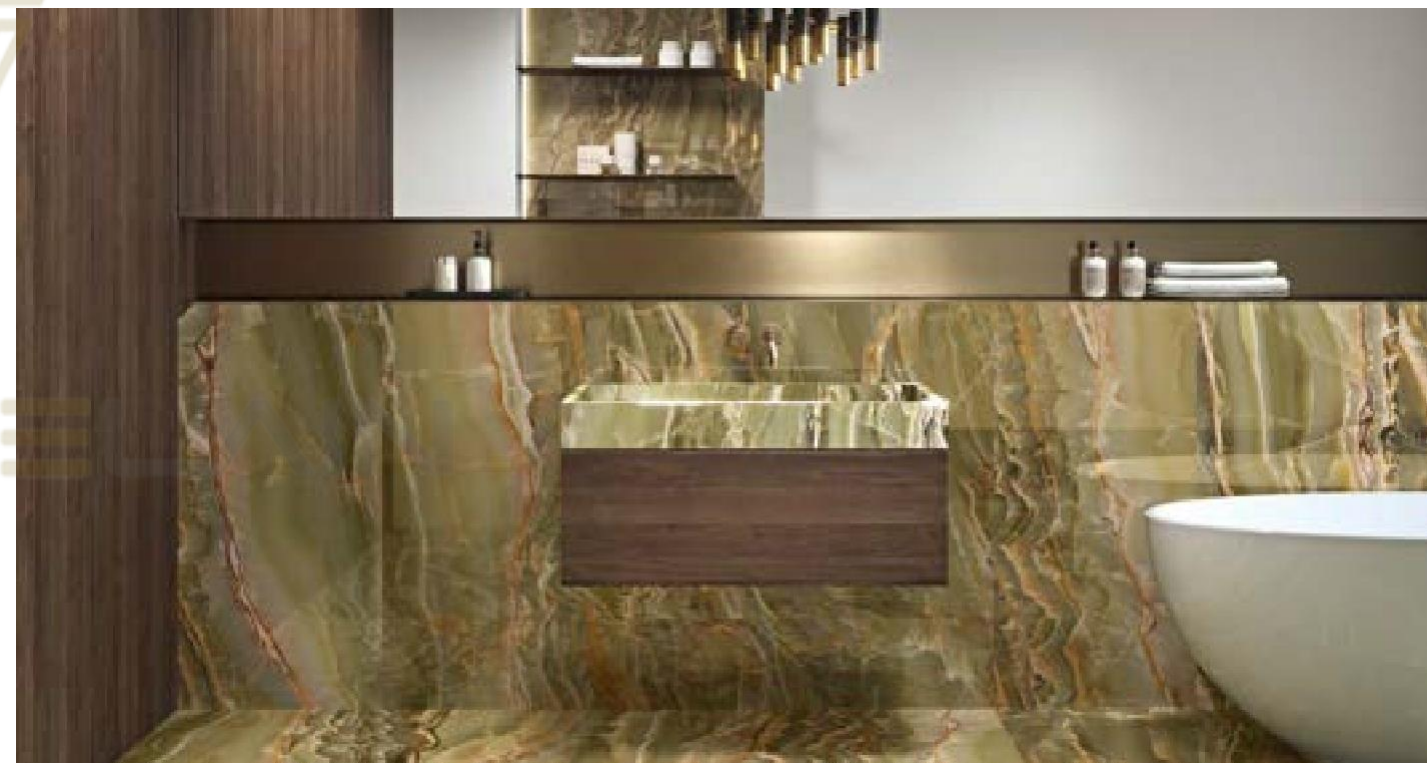
EMERALD ONIX POL RECT 60X120. EMERALD ONIX POL RECT 120X120. PUMICE MATT RECT 60X120

Pour plus d'informations techniques, de spécifications et de visuels, visitez notre site web et recherchez : Dedalus L'emballage des articles est sujet à variation, pour obtenir les données exactes et actuelles il est recommandé de consulter notre site web.