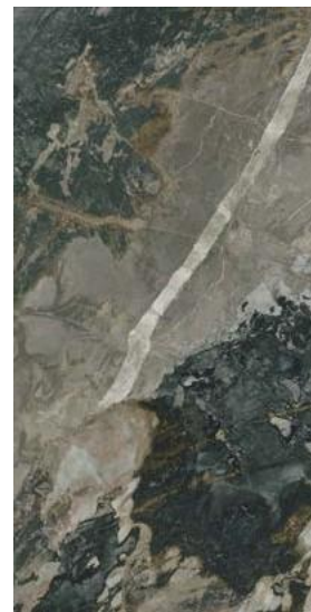
DEDALUS POL RECT 60 X 120 / 24'' X 48''